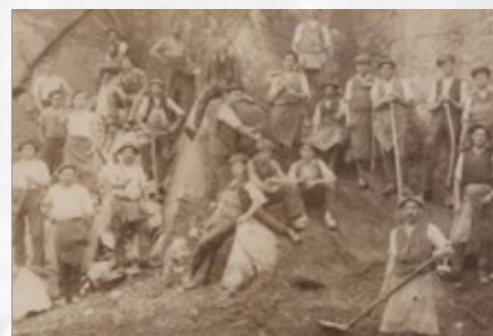
Beispiele Dokumente, Videos und Fotos (Shoah Foundation, Sammlung Linsbauer)